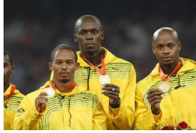
Bolt verliert Staffel-Gold endgültig : CAS lehnt...