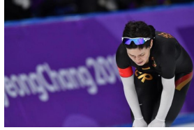
Eisschnelllauf-Meisterin beendet Laufbahn frus...