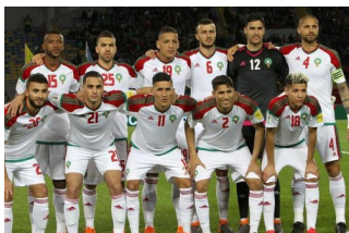
Marokko im WM-Test gegen die Ukraine torlos :...