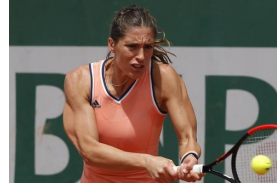
Petkovic und Marterer folgen Zverev in dritte...