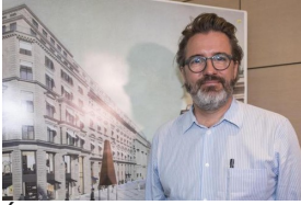
Ólafur Eliasson gesteht «ein Stück Himmel» für...